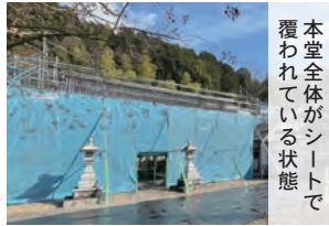
本堂全体がシートで覆われている状態

作業を進行するにつれて解ったことが、以前葺葺の状況から瓦に葺き替えられたのが、昭和三十七年と鬼瓦に刻印されていました。文化庁との打ち合わせの中で、既存の材料を修復し再利用するよう指示がありましたが、その鬼瓦も大きな亀裂があり、今後使用するには安全面で危険な状況であることを確認しております。長年において雨・風・雪に耐えていくためには、新規材料を使用することが、結