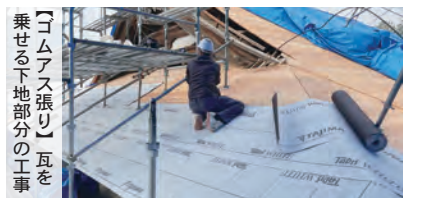
【Gムアス張り】瓦を乗せる下地部分の工事