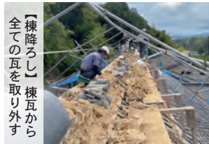
【棟降ろし】棟瓦から全ての瓦を取り外す