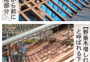
【野垂木増し打ち状況】垂木と呼ばれる下地部分の修繕